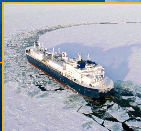
Первый в мире ледокольный газовоз «Кристоф де Маржери»

результаты переходов подтверждают, что возможно увеличение периода коммерческой перевозки грузов в восточном секторе российской Арктики. Это позволяет еще на шаг приблизиться к организации круглогодичной безопасной навигации на всем протяжении трассы Северного морского пути.